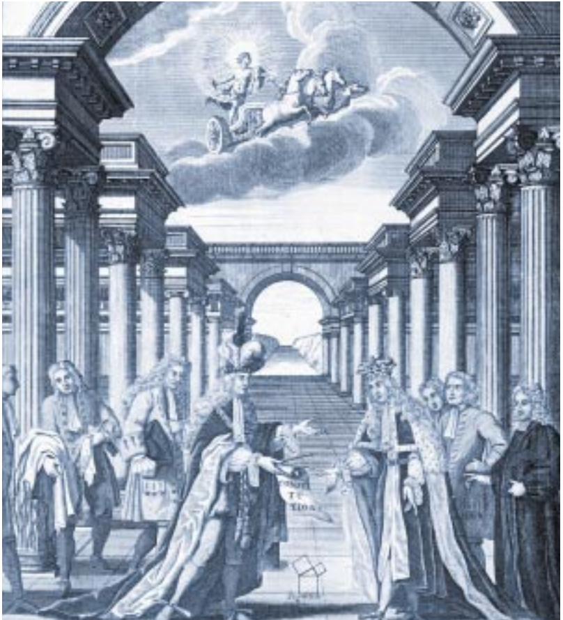
Titelblad van de Constitutions van James Anderson