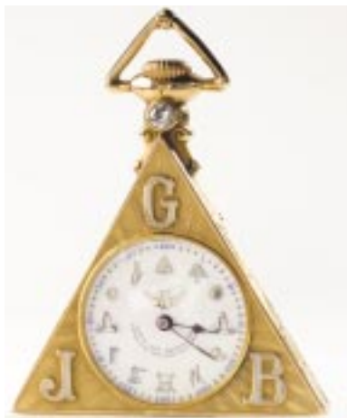
Voorbeeld van een maçonniek horloge

(1683-1744 – zoon van een hugenoten-predikant uit La Rochelle) stond aan de wieg van een van die vele clubs waar de vrijmetselarij uit zou voortkomen. In 1710 werd de nog jonge Desaguliers diaken van de Church of England. In datzelfde jaar is hij ook aanwezig bij de installatie van de Schotse presbyteriaanse dominee James Anderson. Jean Desaguliers was een huisvriend van Isaac Newton. In de jaren tachtig van de zeventiende eeuw was Isaac Newton het onbetwiste middelpunt van de Royal Society geworden en hij zou dit tot zijn overlijden in 1727 blijven. De ideeën van Isaac Newton over harmonie in de kosmos, met als kernbegrippen respect en tolerantie, werden door Desaguliers omarmd. Hij zag die ideeën gematerialiseerd in de St. Pauls Cathedral, ontworpen door de sterrenkundige, filosoof en architect Christopher Wren. Die had de opdracht gekregen deze