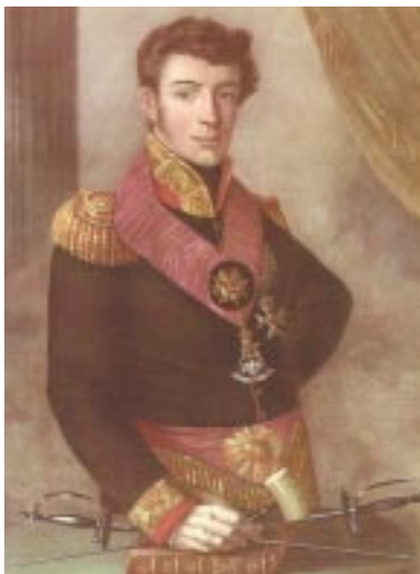
Prins Frederik, Grootmeester Nationaal

drang een poging ondernomen de werkzaamheden van het hoofdbestuur meer te controleren. Na de troonsafstand van koning Louis Bonaparte en de inlijving van Nederland bij Frankrijk vraagt de regering in Parijs de statuten, reglementen en ledenlijsten op. Het doel is de Orde der Vrijmetselaren te verenigen met die van Frankrijk. In november 1812 vaardigt het hoofdbestuur van de Franse Orde een decreet uit waarin gesteld wordt dat 'het Grootoosten van Den Haag niet regelmatig meer kan bestaan, omdat de vrijmetselarij maar één Grootoosten per staat of regering toelaat'. Voordat het zover komt dat de vrijmetselarij in de Nederlanden zich onder het gezag van Parijs schaart, herkrijgt Nederland zijn vrijheid en zelfstandigheid. Op 30 november 1813 zet de Prins van Oranje te Scheveningen voet op