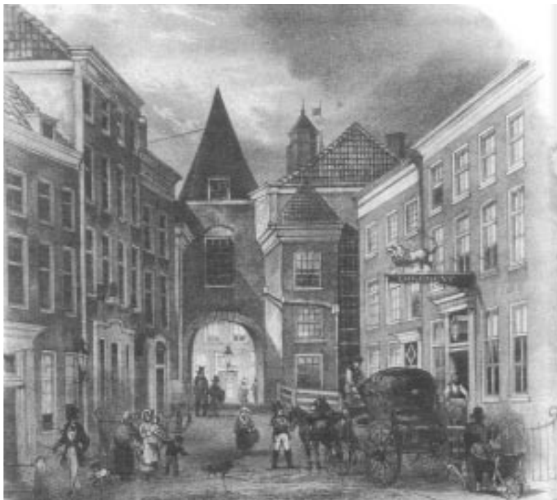
Het logement 'Lion d'Or'

Op 25 maart 1734 wordt het huwelijk gesloten tussen Prins Willem IV en Anna van Hannover, de oudste dochter van George II van Engeland. Kort daarop wordt in Amsterdam een loge gesticht, bestaande uit bijna uitsluitend Engelsen die met de prinses mee naar Holland waren gekomen. De Franse journalist Jean Rousset de Missy (1689-1762), die eerder