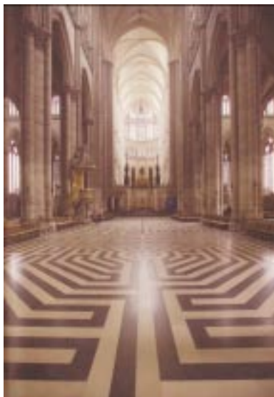
Vloer met labyrint in de kathedraal van Amiens

Vrijheid, verdraagzaamheid en broederschap zijn de drie trefwoorden waarmee de vrijmetselarij kan worden gekarakteriseerd. De vrijmetselarij gaat uit van ieders recht om zelfstandig te zoeken naar waarheid, zij streeft naar de algemene broederschap der mensen, kweekt verdraagzaamheid, zoekt op wat mensen en volkeren vereent en tracht verdeeldheid weg te nemen. Dit zijn grote idealen die zijn vast-