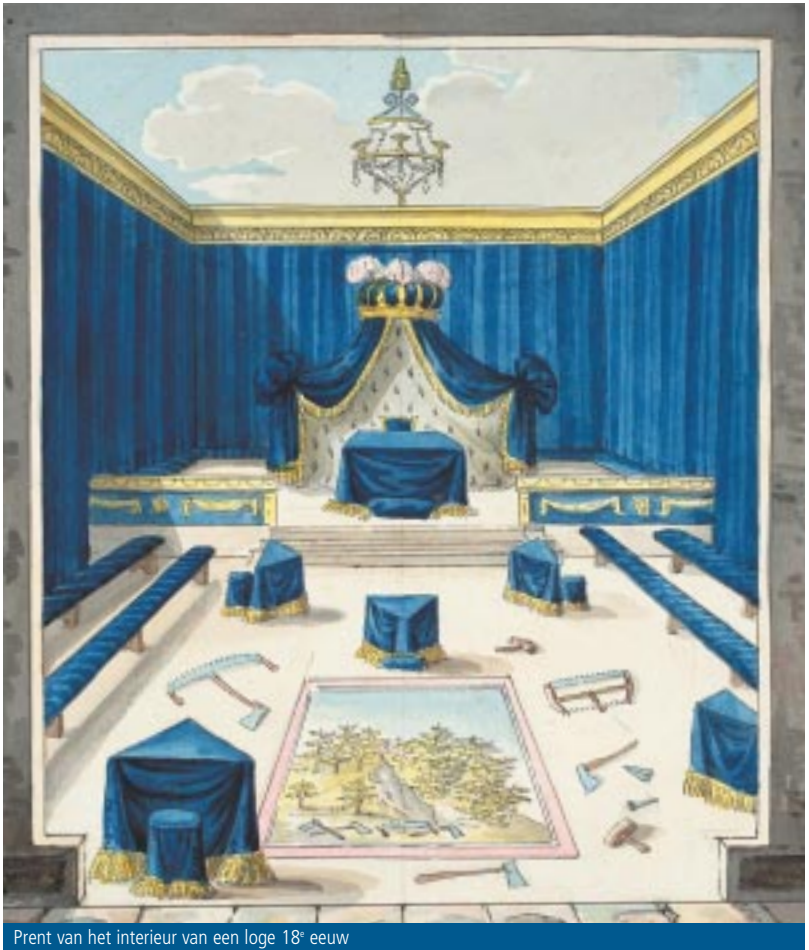
Prent van het interieur van een loge 18 e eeuw

stellen van vergaderruimten aan 'zoogenaamde vrijmetselaren' wordt verboden 'op straffe dat zij als verstoorders der openbare rust zullen worden aangemerkt' . Het Hof van Holland komt op 12 december 1735 met een eigen 'Publicatie teegens de Vrijwillige Metzelaars' , want