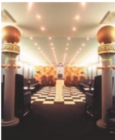
Interieur van een logegebouw