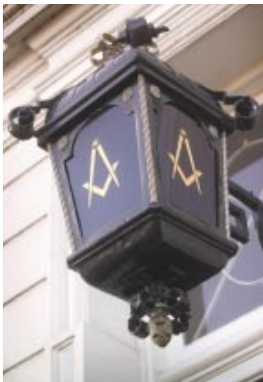
Lantaren naast de deur van het Ordegebouw

Grootmeester (sinds 1928) Hermannus van Tongeren wordt op 11 oktober 1940 gearresteerd. In de periode dat hij in Amsterdam gevangen zat, wordt hij herhaaldelijk ondervraagd. In deze tijd wordt zijn huis herhaaldelijk doorzocht. De bezetter heeft echter nooit één snippertje papier kunnen vinden waarop namen of discriminerende uitlatingen stonden. Op 13 maart 1941 wordt Van Tongeren op transport gesteld naar Duitsland. De reis in een open vrachtwagen duurt negen dagen. Op 29 maart 1941 overlijdt Hermannus van Tongeren in het ziekenhuis van het concentratiekamp Sachsenhausen. De reden waarom Van Tongeren werd opgepakt, is niet duidelijk. Waarschijnlijk verdenken de Duitsers deze ex-KNIL-generaal van verzetsactiviteiten. Ze zitten wat dat betreft er niet ver naast. Kort voor zijn arrestatie had Van Tongeren