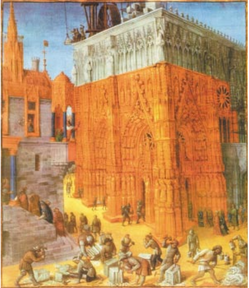
Bouw van een kathedraal door operatieve metselaars

volgende bouwwerk. Dat 'van bouwwerk naar bouwwerk trekken' konden de steenhouwers en metselaars, omdat zij 'een vrij man' waren, vrij om te gaan en te staan waar zij wilden. Dit in tegenstelling tot veel middeleeuwse burgers die vaak