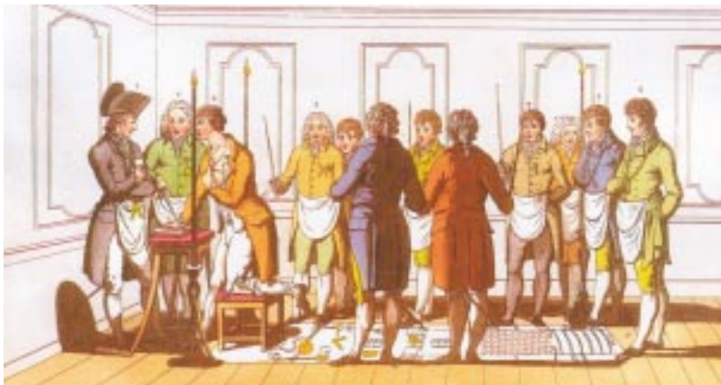
Een inwijding in de 18 e eeuw

waardering van de rechten en plichten van de burger, zijn verhouding tot de staat en de maatschappij en zijn verhouding tot zichzelf en de medemens. Dankzij het vrijwel vanaf het begin der vrijmetselarij in de Nederlanden afgekondigde verbod binnen de loges te praten over politiek of godsdienst kent de vrijmetselarij nu een langdurige bloeiperiode. Ruim duizend vrijmetselaren verdeeld over ongeveer 40 loges verrichten in relatieve stilte hun werkzaamheden 'ter bevordering van deugd en menschenliefde' 3 .